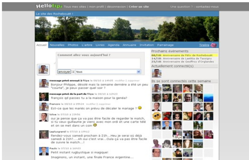
Des nouvelles de toute la famille