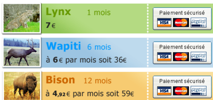
Fig 3 : la tirelire d'un site de famille

J'accepte les conditions générales de vente